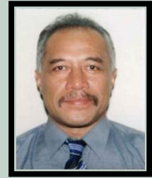
Hon. Tuisugaletauā Aliimalemanu Sofara Aveau

E faamālō foi i le Matāgaluega mo le tapenaga o lenei Fuafuaga Autasi, ma alo ane loa mo lona fa'atinoina aua se manuia o Samoa tapuai mai.