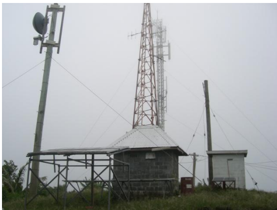
Fesootaiga i Leitio, Olomanu, Taga

Ona o le fuafuaga toe fuata'i a le Malo, ua finagalo ai ia fa'a-ulufale mai faiga fa'atauavaga i le vaega o feso'ota'iga pei ona fa'ailoa i lana Faiga Fa'avae Aoao o Feso'ota'iga; e lua ni kamupani konesale sa galulue fa'atasi ma le matagaluega i le fauina o se tulafono fa'apea ma tulafono fa'atonutonu e pulea ma ta'ita'iina ai auaunaga a le vaega o feso'ota'iga. O se tasi vaega o lea fuafuaga, o le fa'atuina lea o se Ofisa na te fa'atonuina mataupu ma auaunaga tau-feso'ota'iga, ma ua fa'ailoa lea i totonu o le Tulafono o Feso'ota'iga 2005.