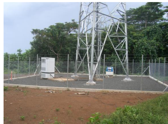
Pou o Feso'ota'iga i uaealesi, Lepiu-Tai, Safotu

O le isi tiute taua o loo faia i le taimi nei, o le fofōina lea o fe'ese'esea'iga e tula'i mai i e o fa'aaogaina alāleo ese'ese, e pei ona tu'uina atu i o latou laisene. O se mata'upu fa'apea, na aliali mai i le va o le kamupani fa'asalalau TV ma leitio a Samoa o le SBC ma le Ofisa o le malae-va'alele, ma sa mafai ona fa'anofofilemū, ina ua soalaupule ma le matagaluega, ma toe siakiina alaleo ua fa'asoaina mo ia kamupani.