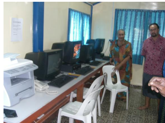
Fesoota'i-Center, Auala, Savai'i

O le fausia o fale ma le fa'atogaina i nofoa, laulau ma kesi na tu'u atu lava i komiti ma autalavou latou te saunia, ma o se vaega lea o la latou fesoasoani i le fa'atuina o le Fesoota'i-Center. O Fesoota'i-Center uma ua fausia ua iai mea nei: