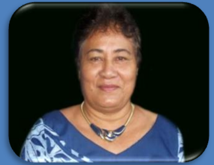
Afioga Safuneitu'uga Paaga Neri

MINISITA O FESO'OTA'IGA, FA'AMATALAGA MA FESO'OTA'IGA VAVAVE FA'ANEIONAPO