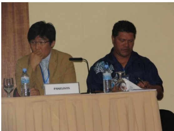
Sui o Kolea, ma le sul o le MCIT i a'oa'oga i atunu'u i fafo